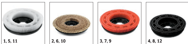
1, 5, 11