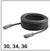
30, 34, 36