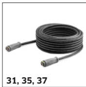
31, 35, 37