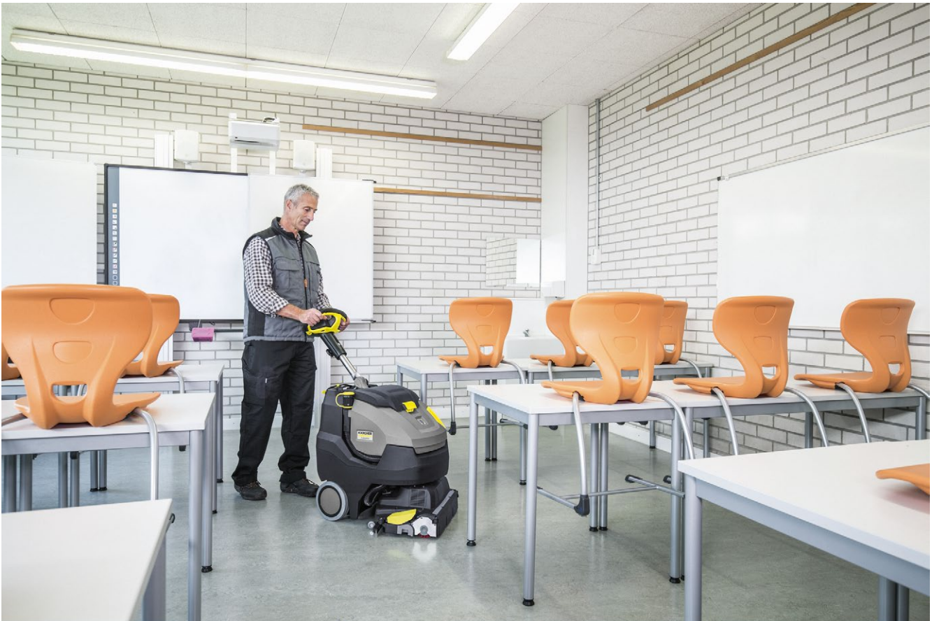
BR 45/22 C Bp Pack Fleet *EU