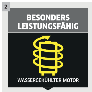
2 Wassergekühlter Motor und überragende Leistung