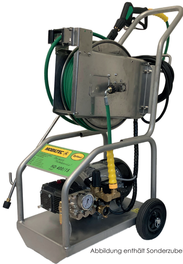
Abbildung enthält Sonderzubehör