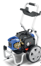
234653 (ohne Gerät)